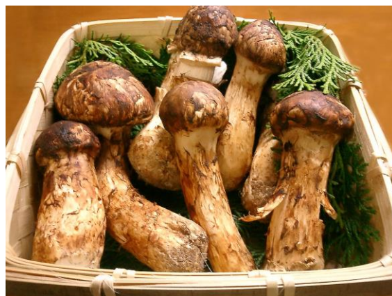
高価な松茸の香り