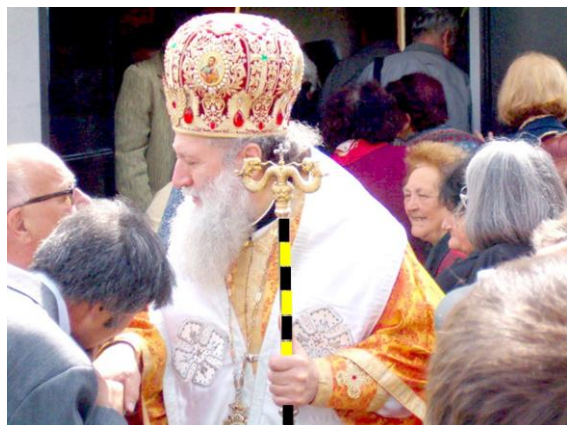
まあツエがシマシマね